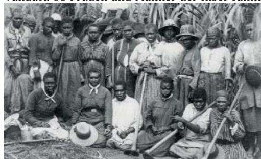
Arbeitskräfte von den pazifischen Inseln auf einer Zuckerrohrplantage in Australien.

Ab 1863 Anwerbung von Arbeitskräften für Plantagenarbeit in Australien, Neukaledonien und anderen pazifischen Inseln. Das so genannte „Blackbirding“ betrifft die gesamte südpazifische Inselwelt. 1863 wurden vom heutigen Vanuatu 68 Frauen und Männer der Insel Tanna